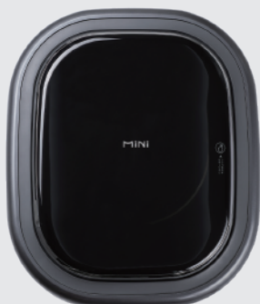
WM30XHQGWL//6031 全自动迷你壁挂滚筒洗烘一体机